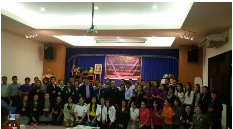
พิธีปิดและมอบเกียรติบัตร